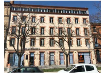
Agence BG à Toulouse