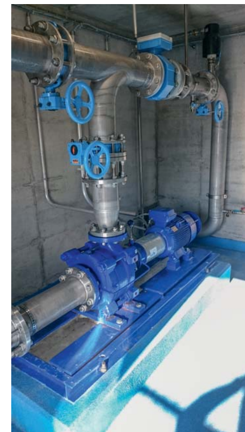
Microcentrale de turbinage d'eau potable de Châble III - Commune de Vionnaz. Pompe inversée 15 kW

13h30 Fin du séminaire et visite du salon