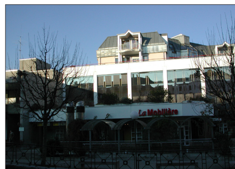
Agence de BG à Delémont